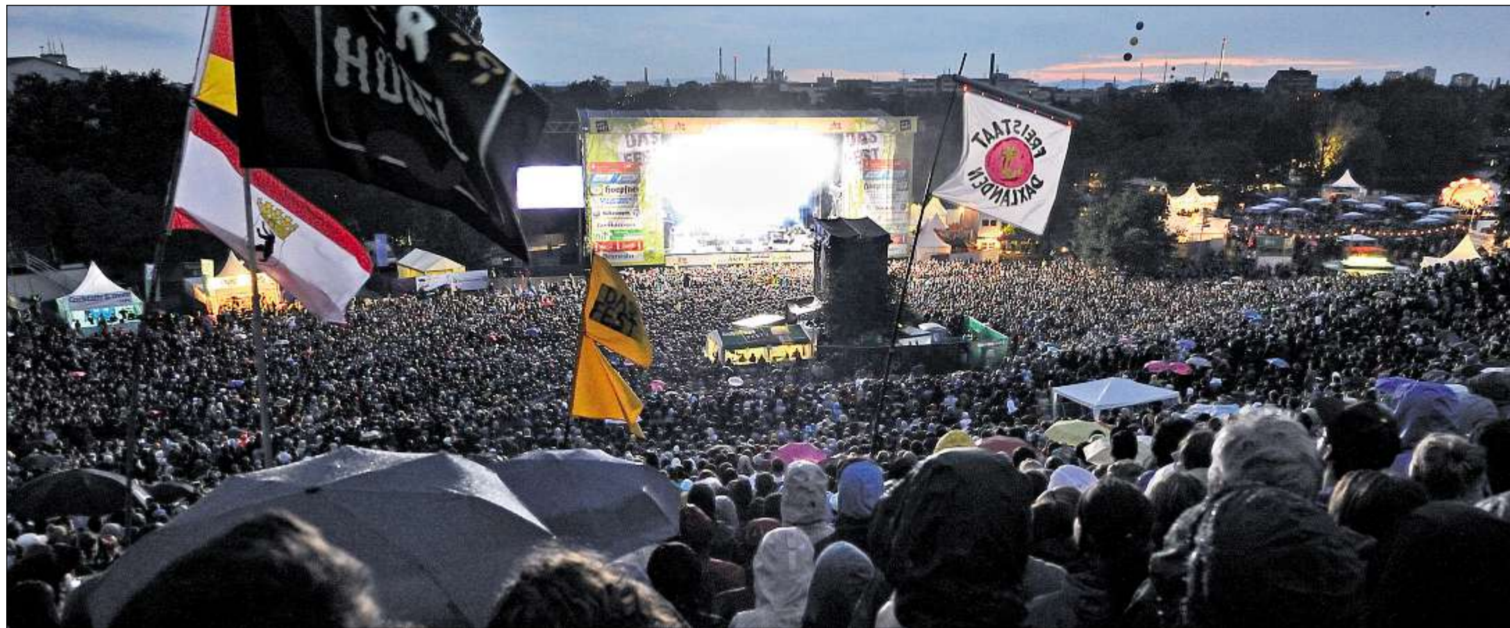
DAS „FEST“ LOCKT TROTZ REGEN DIE MASSEN: Gestern ging das größte Open-Air-Festival im Südwesten zu Ende, zu dem am Wochenende insgesamt über 210 000 Besucher kamen.