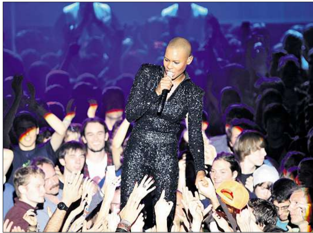
SORGE FÜR EINEN „FEST“-HÖHEPUNKT: „Skin“, Frontfrau von Skunk Anansie, suchte den Kontakt zum Publikum und badete gleich mehrfach in der Menge.